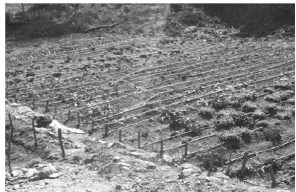
Foto 9. Mangueras con goteros en los surcos del biohuerto.