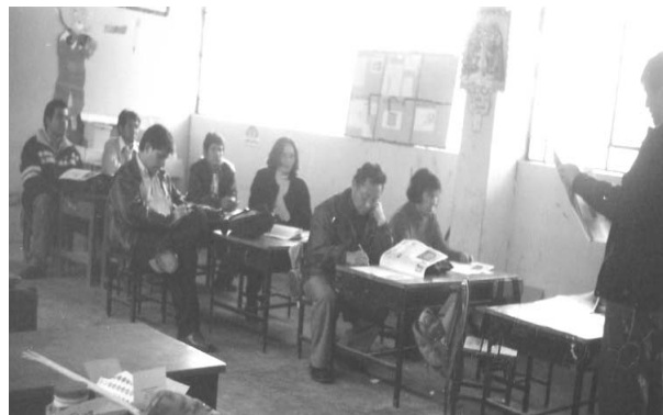
Foto 11. Profesores de primaria y secundaria asistieron a la capacitación Inaugurada por el director del IIGEO-UNMSM.