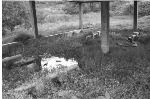
Foto 3. Acumulación de lodo, agua y vegetación en el lecho de secado de lodos antes del inicio del proyecto.

La tubería de 6" de diámetro de PVC conexiona el tanque con el lecho que alimenta a cuatro puntos, cada uno de las cuales tiene su respectiva loza. El lecho consta de dos tuberías de salida que evacúan las aguas a una acequia colindante. Este lecho de secado, por falta de mantenimiento, estaba saturado con lodo y vegetación, desconociéndose la conformación del medio filtrante, y no cumplía los requerimientos mínimos para el cual fue construido. (Foto 3).