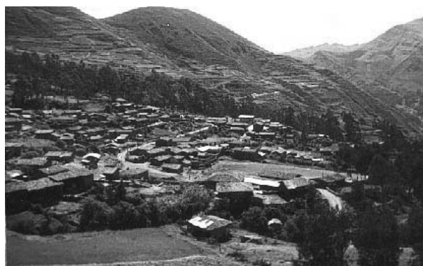
Foto 1. Vista panorámica de la comunidad urbana de Lacabamba.

Por el Convenio Marco firmado entre la Municipalidad y UNMSM (IIGEO), en el año 2003, se elaboró el Plan de Desarrollo del 2003 al 2012 con la participación activa de la población.