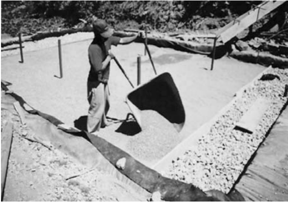
Foto 6. Colocación del medio filtrante en el humedal.

En la cabecera del humedal se instaló un sistema de ingreso de agua a través de un codo y una tubería de PVC transversal perforada con el objetivo de distribuir el agua de modo uniforme. Esta tubería se cubrió con una capa de grava de 1/2" de diámetro. Igualmente la tubería que recoge el agua residual tratada está conformada por una tubería de PVC de 2" de diámetro con perforaciones de 10 mm de diámetro recubierta con una capa de 1" de diámetro.