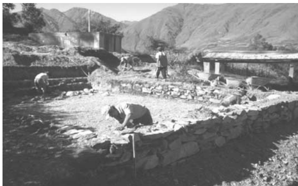
Foto 4. Construcción de muros de sostenimiento en las paredes del humedal.

Así mismo se determinó el uso de materiales del lugar, como: 11.934 m 3 de piedra chancada, 5.616 m 3 de arena gruesa, 7.02 m 3 de confitillo, 130 m 2 de geomembrana de PVC, 88 m 2 de geotextil, tuberías de PVC 2", llaves compuertas, pegamento, mallas, otros.