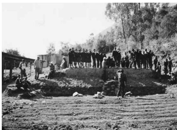
Foto 13. Charlas, alumnos de primaria y secundaria.