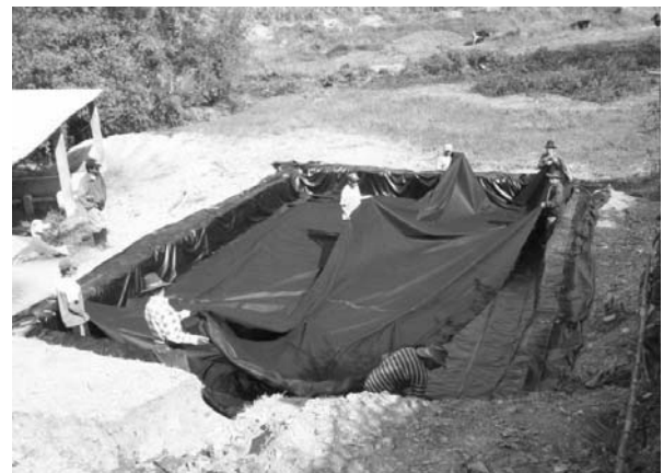
Foto 5. Colocación de la geomembrana de PVC y del geotextil.

Teniendo en cuenta los criterios de diseño, el medio poroso está constituido por un substrato de grava y arena usando 3 tamaños de material dispuestos desde el fondo hacia arriba: piedra chancada (1" de Ø) con una altura de 0,15 m; confitillo (3/8") con una altura de 0,10 m; arena gruesa con una altura de 0,15 m y confitillo (3/8") con una altura de 0,05 m. (Foto 6).