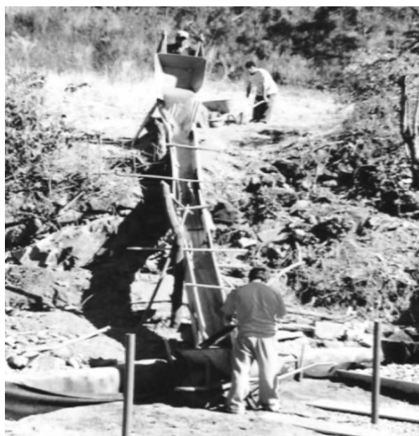
Foto 12. Comuneros participando en la construcción del humedal.