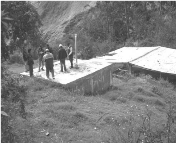
Foto 2. Inspección del tanque Imhoff y el lugar del proyecto por el equipo técnico IIGEO - UNMSM.

El tanque de aguas residuales se detectó en mal estado, sin expediente técnico; este fue construido en 1996 por el Fondo Nacional de Compensación y Desarrollo Rural - FONCODES (Presidencia de la República), se planteó rediseñarlo para reserva y tratamiento primario de las aguas residuales para abastecer el humedal artificial que se construiría.