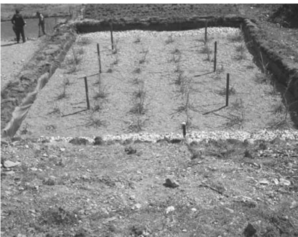
Foto 7. Vista del humedal artificial con carrizos sembrados.

La carga hidráulica o tasa de aplicación hidráulica en el humedal es de 0,051 m/día, con una capacidad de almacenamiento de 12,84 m 3 de agua residual. En el humedal se sembró rizomas de carrizo o caña brava, con una tasa de transplante de rizomas de 5 plantas/m 2 , para que garantice una buena cobertura a los tres o cuatro meses de sembrío (Foto 7).