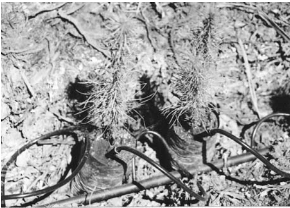
Foto 10. Vista del riego presurizado en almacigos de pino.

lo largo de los 37 surcos, correspondiendo un 60% a hortalizas, 20% a plantas ornamentales y el 20% a plantas forestales.